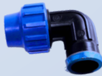
Codo de Compresión