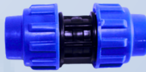
Unión de Compresión