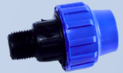
Adaptador de Compresión Macho